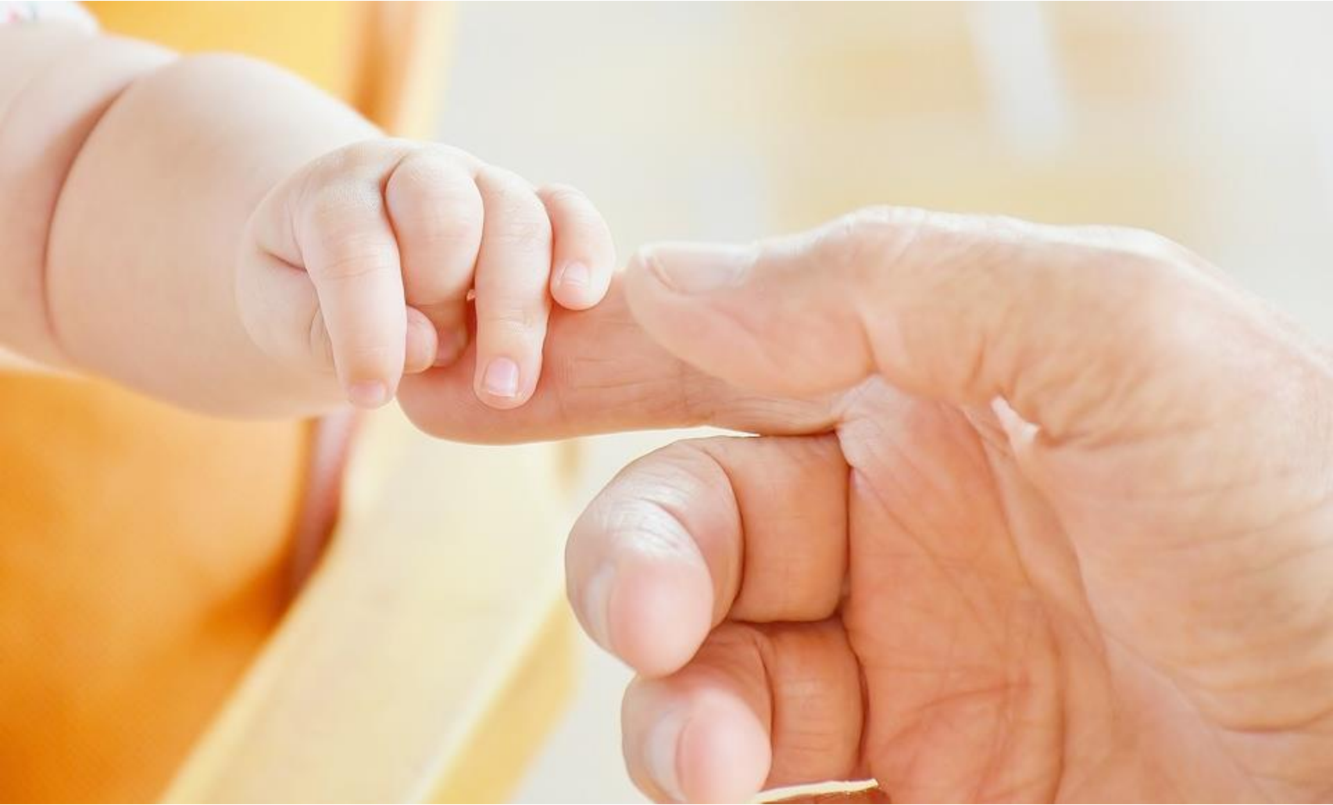
Image Credits: Page 1, 3 & 5: designed by Freepik/ Page 2: By LUMO Project via www.freebibleimages.org/ Pages 4 & 7: public domain/ Page 6: Designed by jcomp/Freepik Text from the Bible