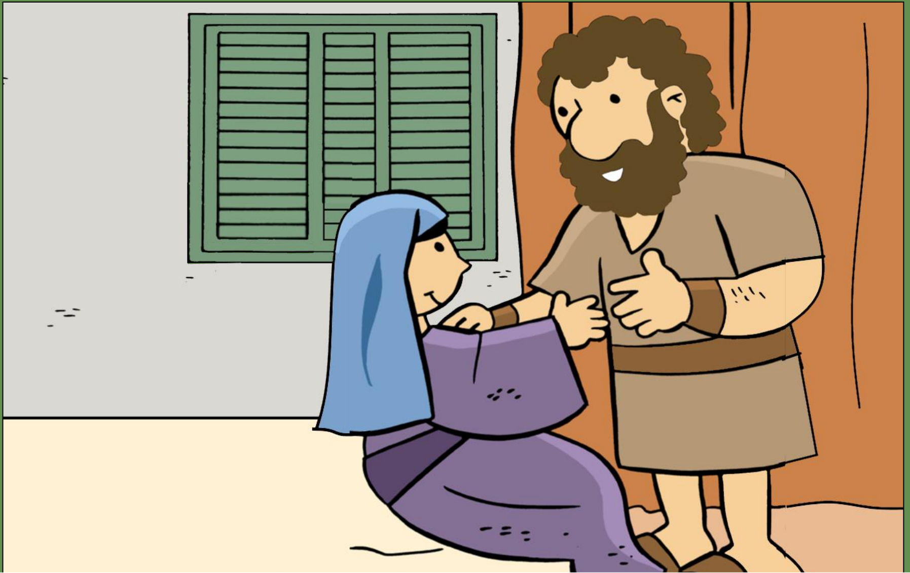
Peter Raises a Woman from the Dead Pietro risuscita una donna