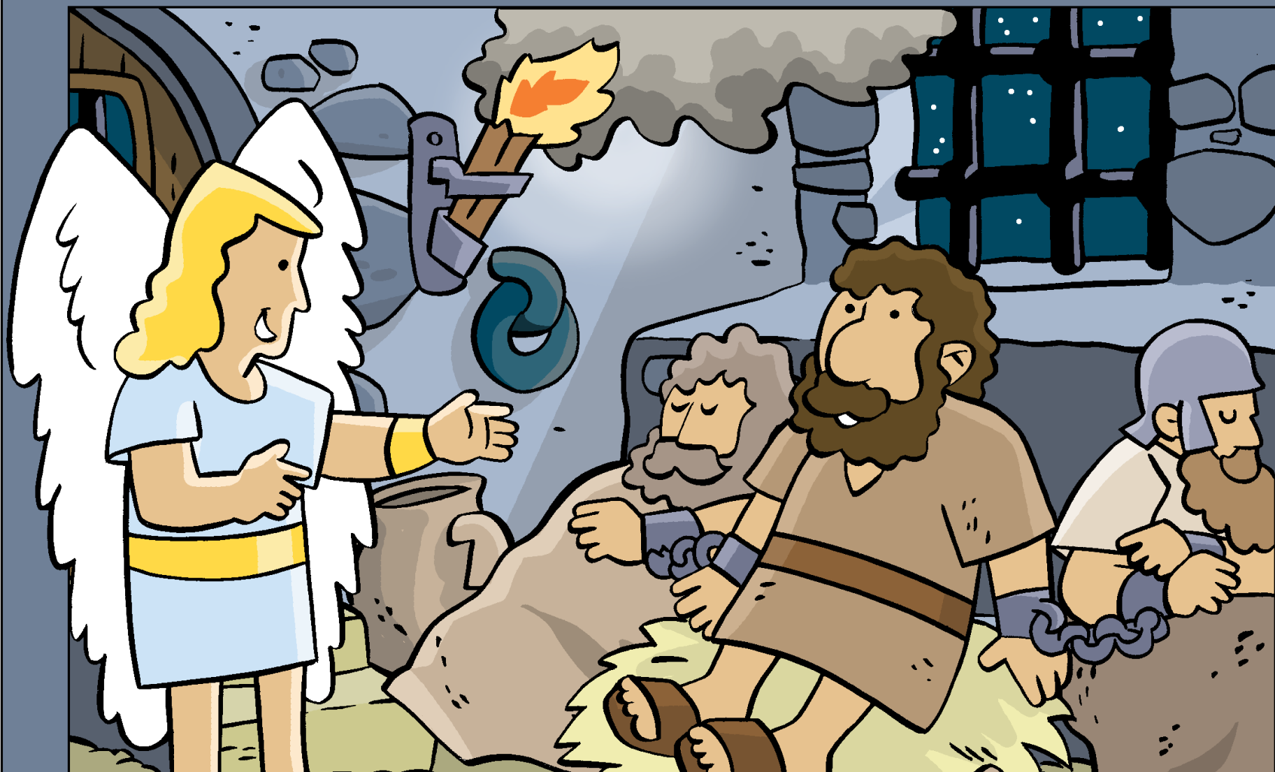
An Angel Frees Peter from Prison Pietro è liberato dal carcere da un angelo