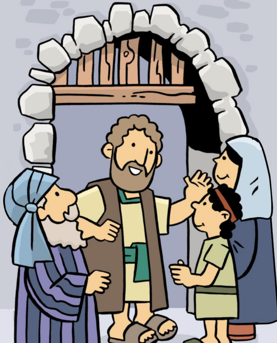
Stephen Preaches to the People Stefano predica Gesù