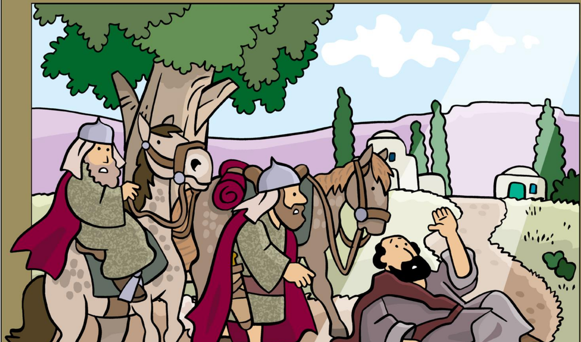
Paul Becomes a Follower of Jesus Paolo diventa cristiano