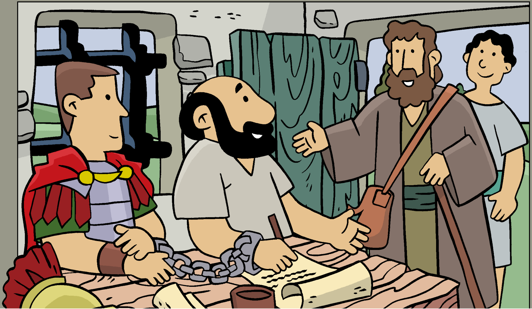
Paul Writes the Epistles Paolo scrive le Epistole